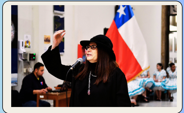
CELEBRACIÓN FIESTAS PATRIAS