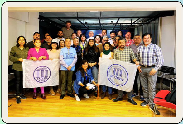
CARRERA FUNCIONARIA: ACUERDO CON LA AUTORIDAD